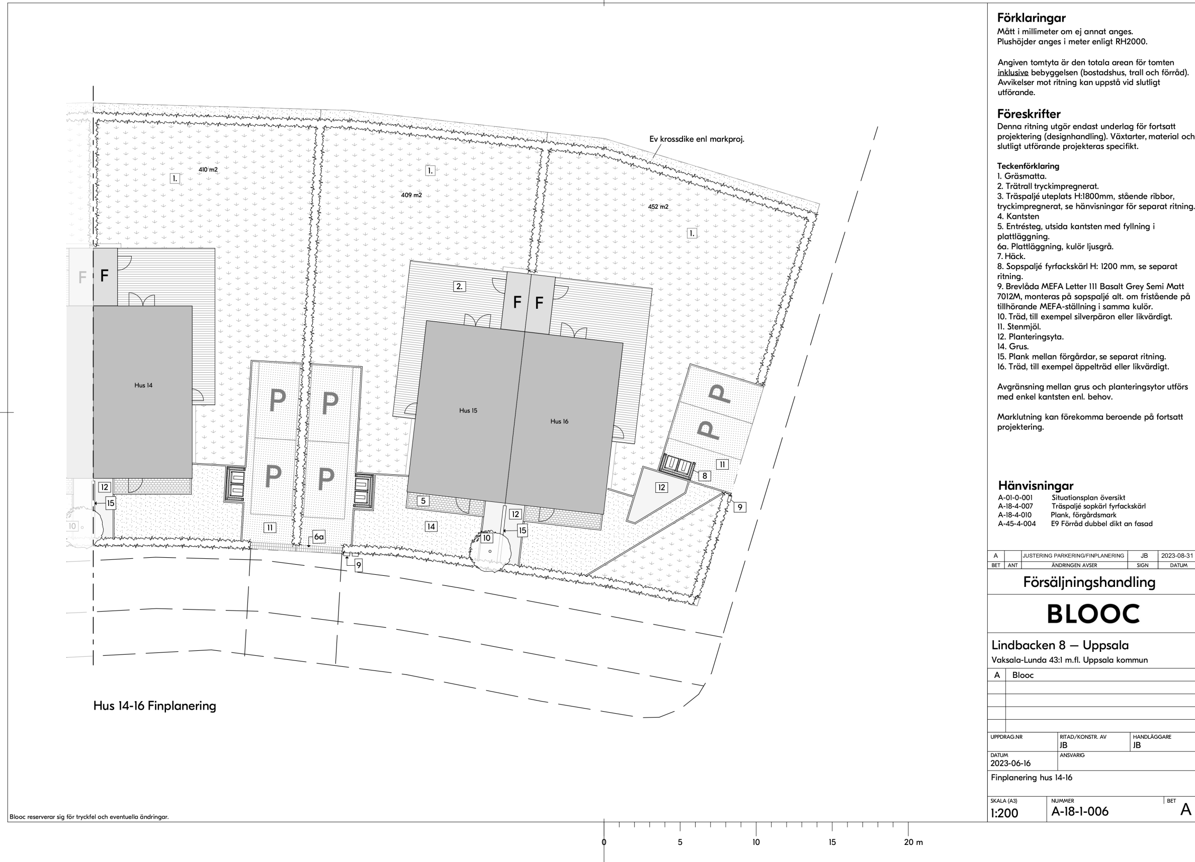
Hus 14-16 Finplanering