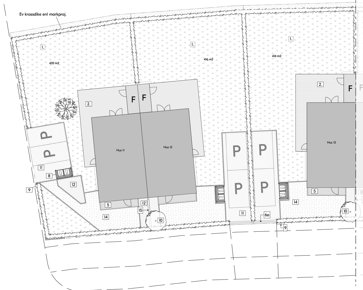
Hus 11-13 Finplanering

Blooc reserverar sig för tryckfel och eventuella ändringar.