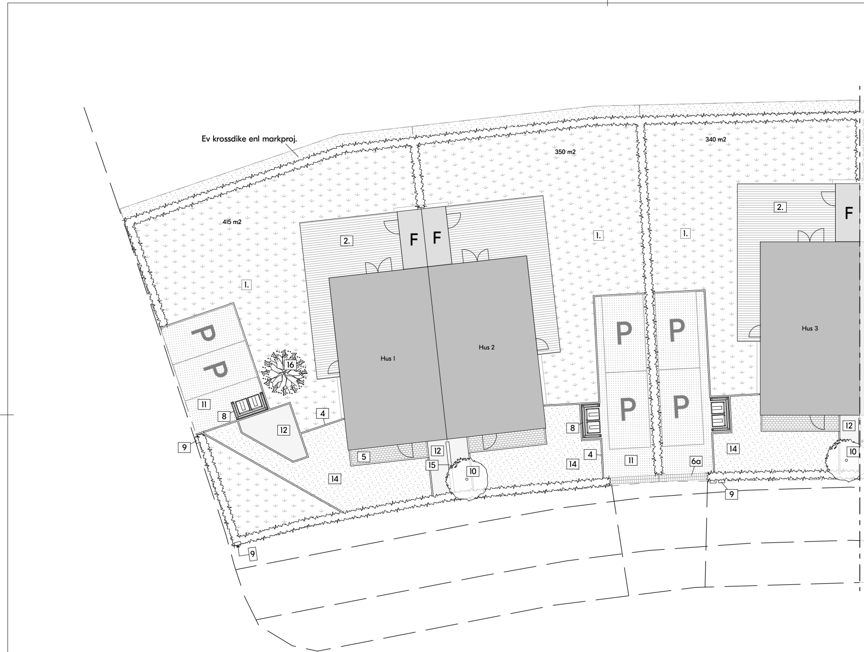
Hus 1-3 Finplanering

Blooc reserverar sig för tryckfel och eventuella ändringar.